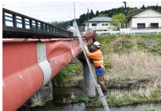
富岡町水管橋点検業務