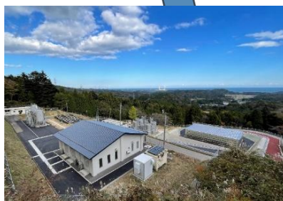
双葉地方水道企業団 小滝平浄水場改修工事 (設計・積算・工事管理)