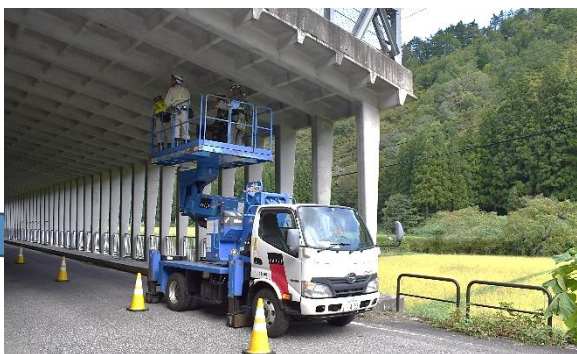
只見町塩ノ岐スノーシート点検業務