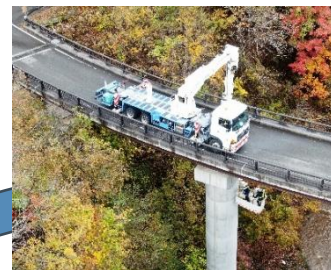
飯舘村堰堤橋点検業務