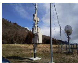
昭和村ラジオ難聴解消事業(積算・工事管理)