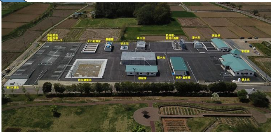
鏡石町鏡石浄水場(積算・監督員支援)