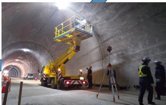
道路橋りょう整備工事(博士トンネル設備工事) (積算・工事管理)