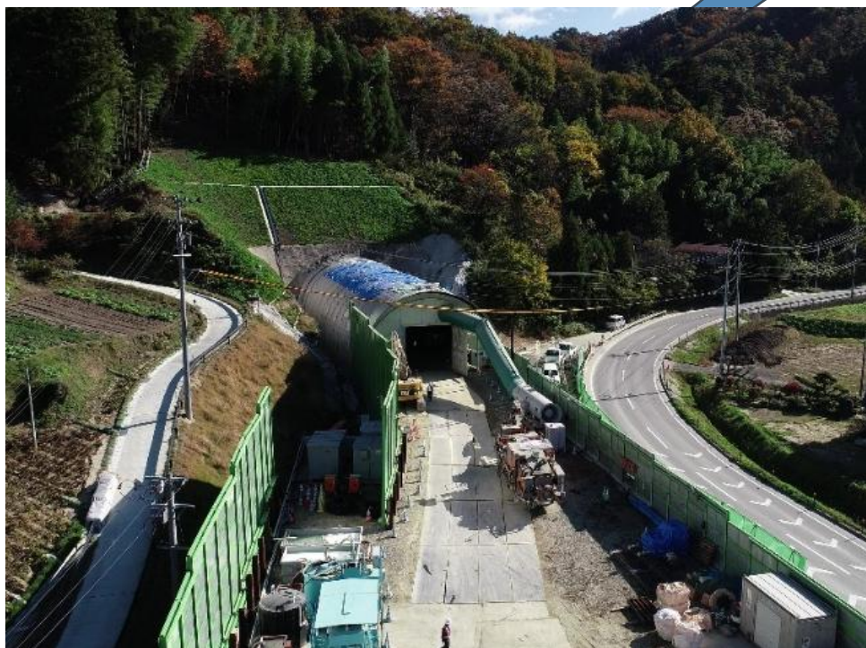
福島県国道 114 号関場トンネル本体工事(積算・監督員支援)