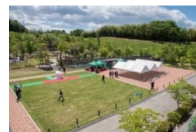
本宮市英庭園イベント広場整備工事 (設計・積算・工事管理)