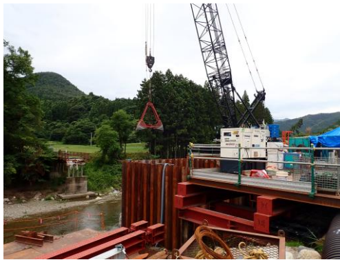
相馬市茄子小田橋災害復旧工事 (設計・積算・工事管理)