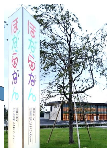
鏡石町健康福祉センター