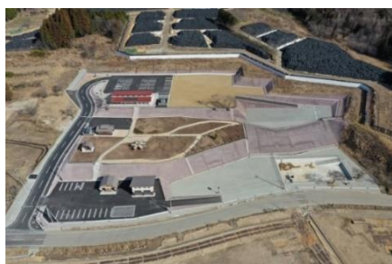
飯舘村長泥地区居住促進ゾーンの造成工事、集会施設等の整備工事(設計・積算・工事管理(監理))