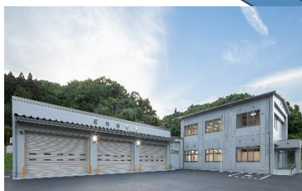
石川消防署庁舎(設計・積算・工事監理)