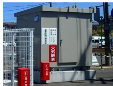
須賀川地方広域消防組合 非常用電源設備工事 (設計・積算・工事管理)